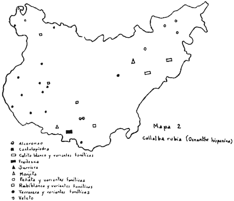
Fig. 2.—Distribución de nombres vernáculos de Collalba, por la provincia de Badajoz.